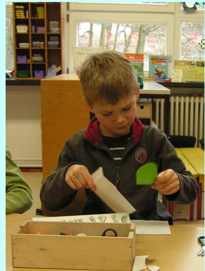
Es wurde begeistert und konzentriert gearbeitet.

Dass es neben bösen Bakterien auch gute gibt, wurde in weiteren kleinen Modulen gemeinsam mit den Kindern erarbeitet.